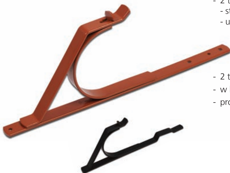
Uchwyt do belek okrągłych Ø 140 mm