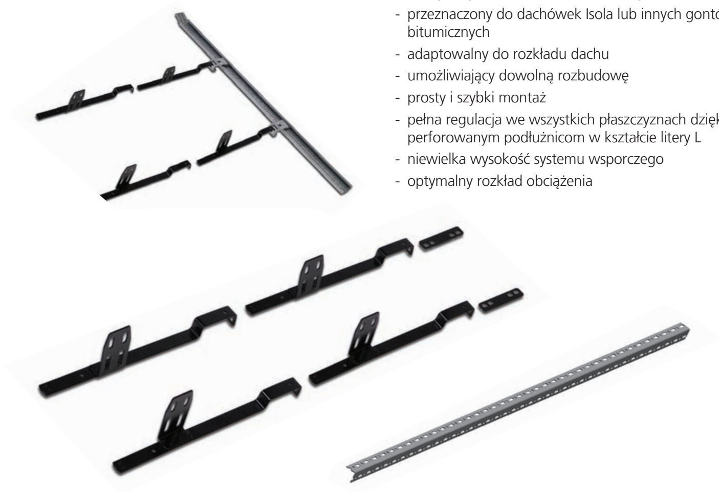
System wsporczy kolektorów słonecznych