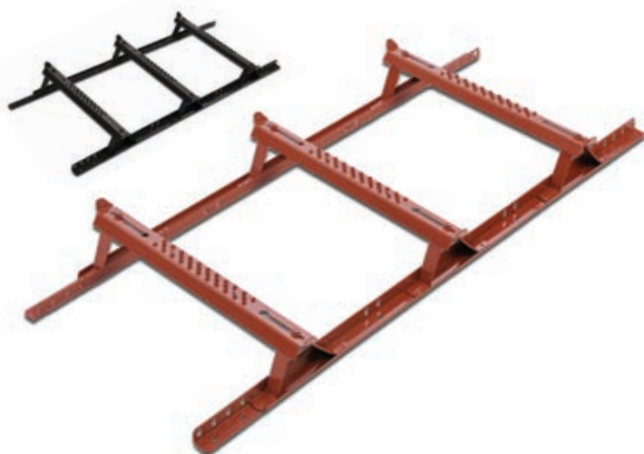
Drabina 3. stopniowa