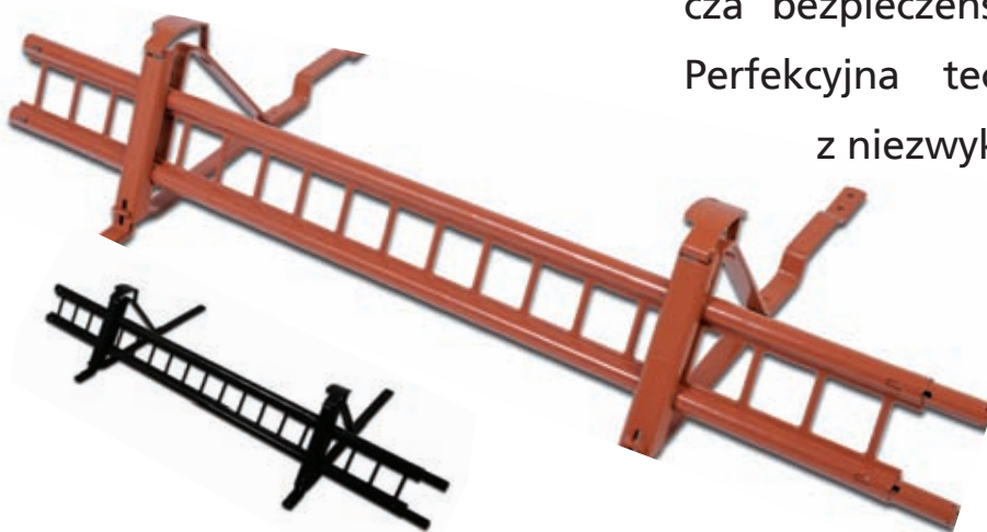
Bariera ze wspornikami

Absolutna kontrola nad śniegiem oznacza bezpieczeństwo przez całą zimę. Perfekcyjna technika w kombinacji z niezwykle wyjątkowym wyglądem. A nade wszystko sprawdzone bezpieczeństwo na dachu.